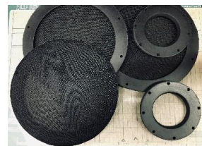
エスカレートしたジュラルミンバッフル